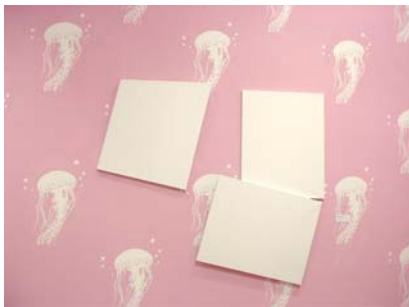
Semaeostomeae II et l'œuvre de François Morellet