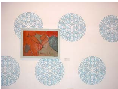
Wandering ascetic II et l'œuvre de Nicolas de Staël

Plus loin, Composition , 1949, de Nicolas de Staël contre Wandering ascetic I , le all-over de 1953 par Jean-Paul Riopelle, opposé au fond parme des méduses : les œuvres modernes plus anciennes se perçoivent pleinement comme objet et non pas surface peinte.