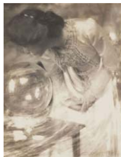
Gertrud Käsebier Le Cristal magique