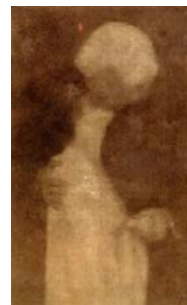
Anonyme Le Baiser