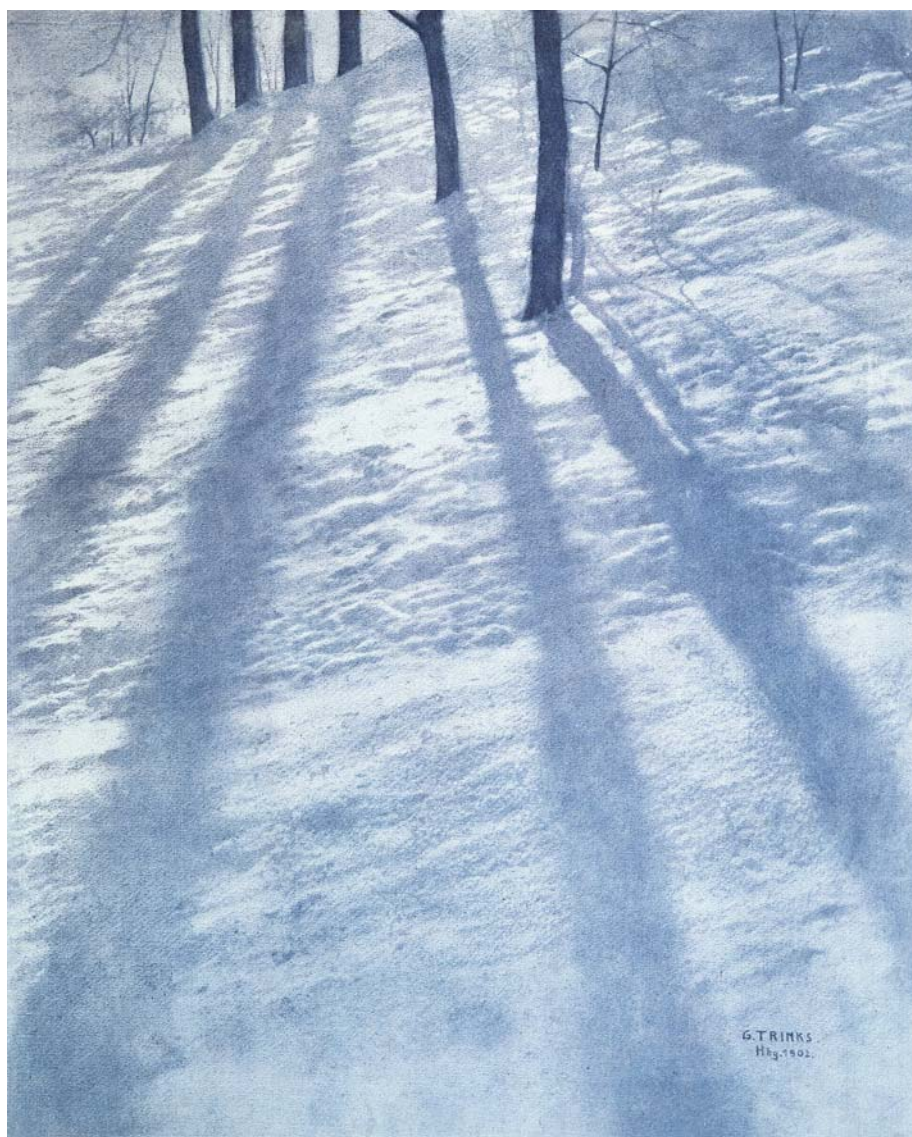
Gustav E. B. Trinks Ombres colorées 1902