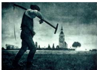
Nicola Pescheid Paysan à la faux