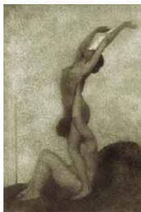
Frantisek Drtikol Composition aux deux modèles