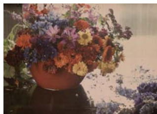
Adolphe De Meyer Etude de fleur