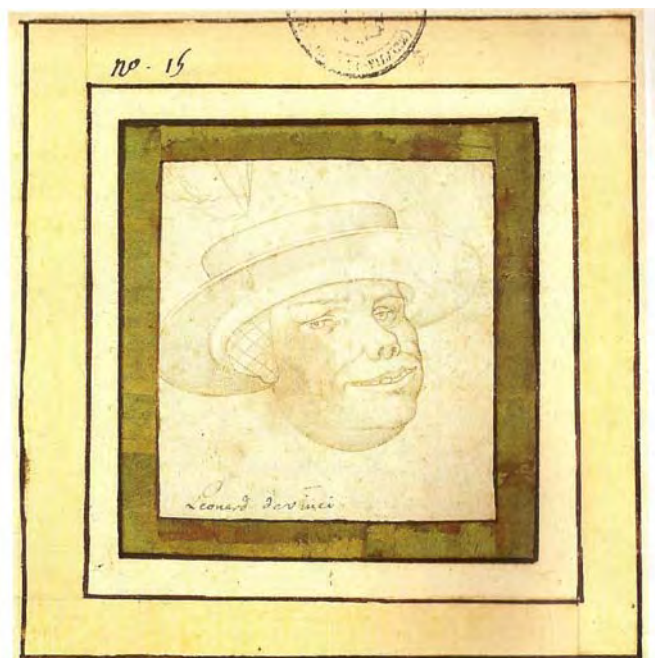
4. Tête d'homme portant un chapeau Pointe d'argent sur papier préparé blanc. 7,9 x 7,4 cm

Pisanello Tête d'homme portant un chapeau Pointe d'argent sur papier préparé blanc. 7,9 x 7,4 cm