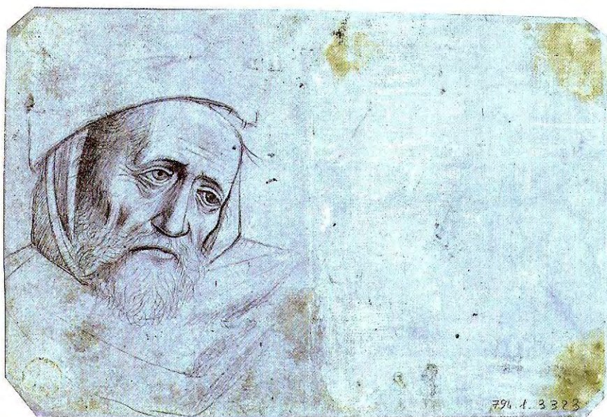
Fig. 1b - Photographie en fluorescence d'ultraviolets du verso de la feuille. Les traces de colle apparaissent sous la forme de taches brunes, et le pli central est bien visible.

Anonyme hollandais, Une tête d'homme (verso) Pointe d'argent sur papier préparé blanc. 13,6 x 19,6 cm