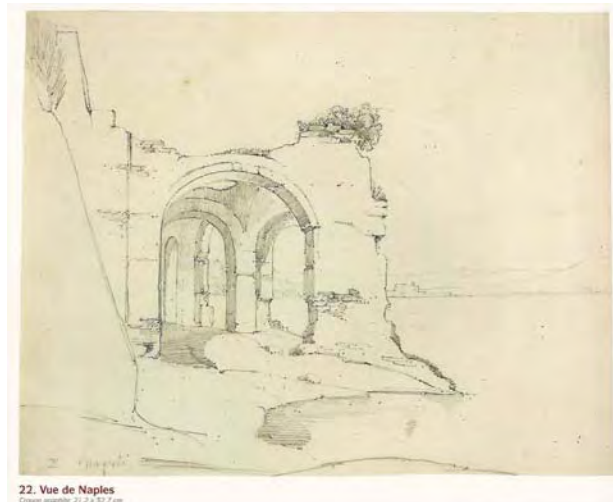
22. Vue de Naples Crayon graphite. 21,2 x 32,7 cm