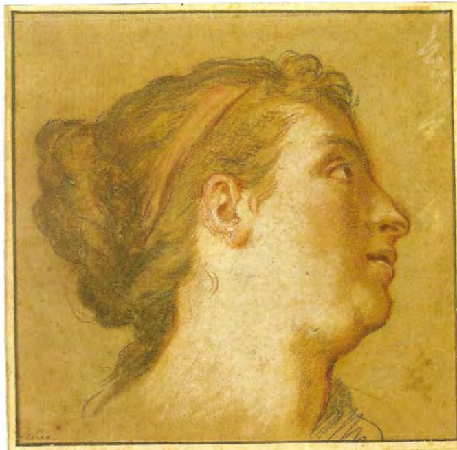
François Marot Tête de femme Pierre noire, sanguine, craie blanche. 15 x 15,2 cm