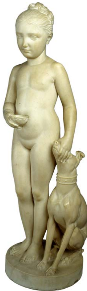
Lorenzo Bartolini Napoléone-Elisa Baciocchi 1812