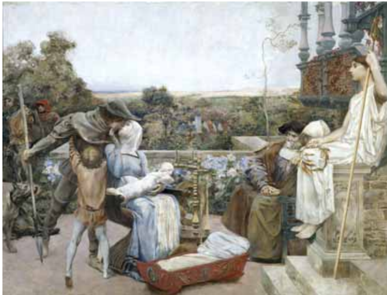
La Famille , décor de l'hôtel Watel-Dehaynin, 1901 Paris, Musée d'Orsay