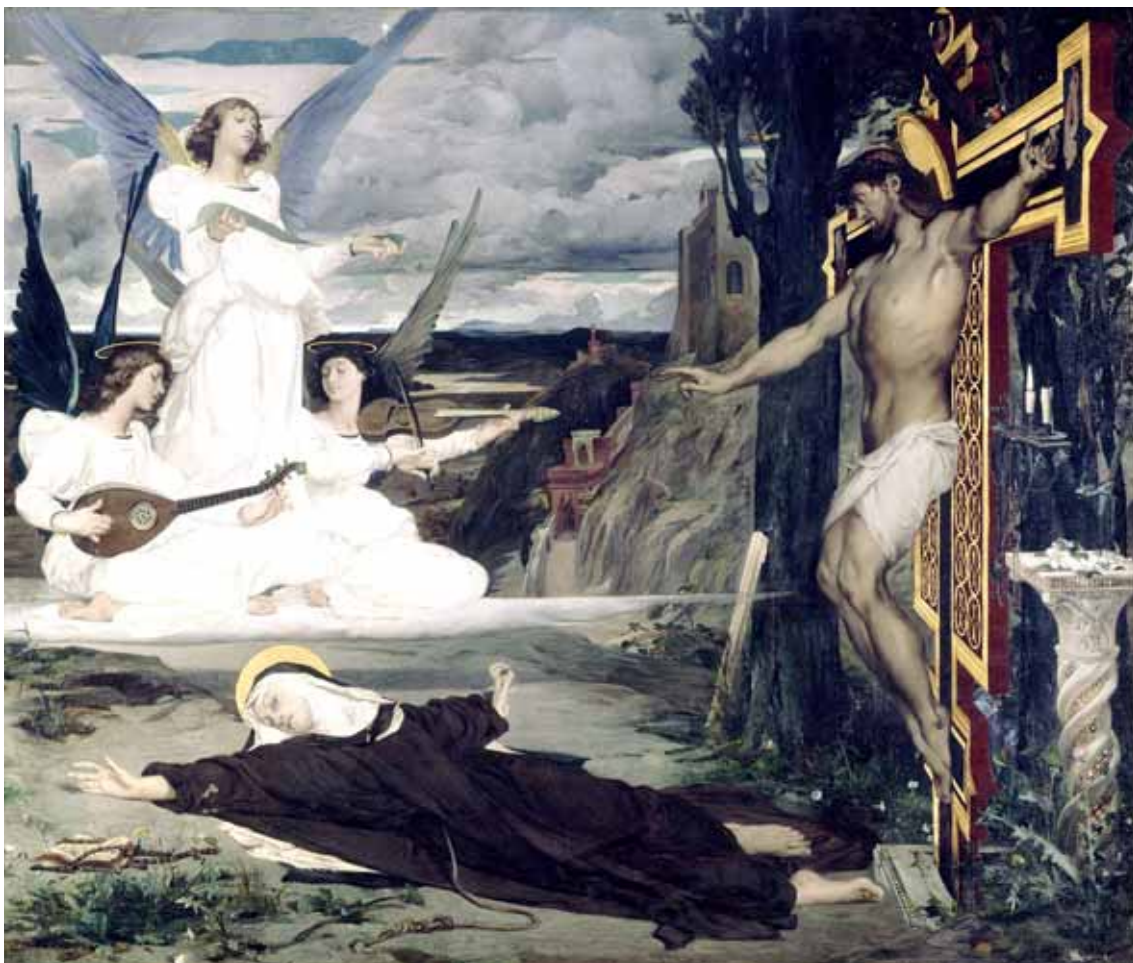
Vision, légende du XIV e siècle, 1872 Lille, Palais des beaux-arts

Et on ne peut qu'être étonné sur ce point de constater le réel succès public et l'intérêt des amateurs qui ont accueilli Saint François convertissant le loup de Gubbio , production inachevée par principe puisqu'elle est... l'esquisse exposée à Paris en 1873, au titre d'envoi obligatoire de troisième année !!