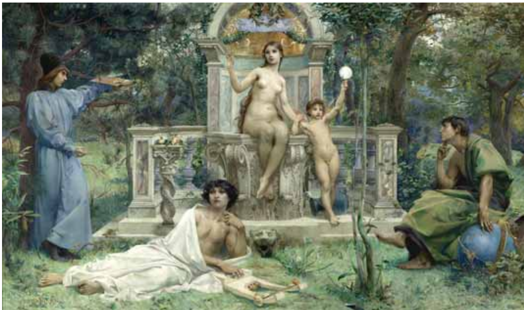
La Vérité , décor de l'hôtel Watel-Dehaynin, 1901 Paris, Musée d'Orsay