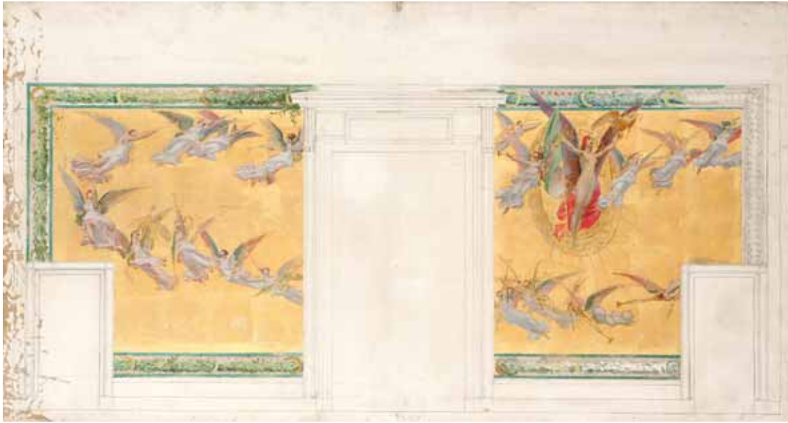
L'Apothéose de la Liberté , projet de décor pour le Parlement de Mexico, 1911 Lunéville, Musée du château

Il se trouve être, de ce fait, l'interlocuteur tout indiqué pour réaliser les cartons destinés aux manufactures nationales des Gobelins ou aux ateliers de mosaïque et de vitraux, et à plus forte raison celui à qui on demande des maquettes pour les timbres-poste et les billets de banque.