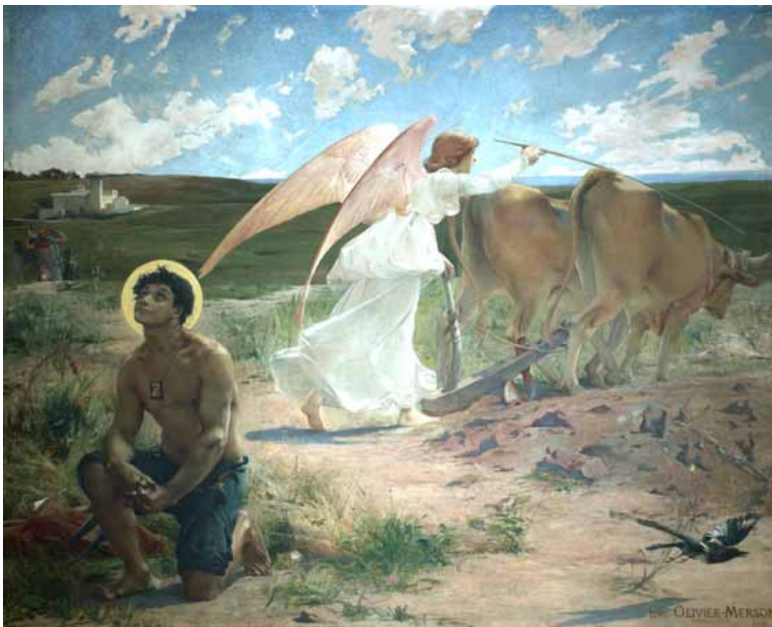
Saint Isidore, laboureur, 1878 Rouen, Musée des beaux-arts