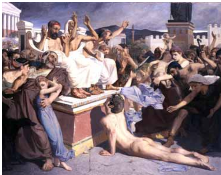
Le Soldat de Marathon , 1869 Paris, Ecole nationale supérieure des beaux-arts

Le grand prix de Rome est attribué à Merson en 1869 pour une composition en frise sur le thème de la bataille de Marathon ( Le Soldat de Marathon ). Malgré de vives protestations, sa place de premier est maintenue. Il obtient ainsi le droit de séjourner à la Villa Médicis à Rome.