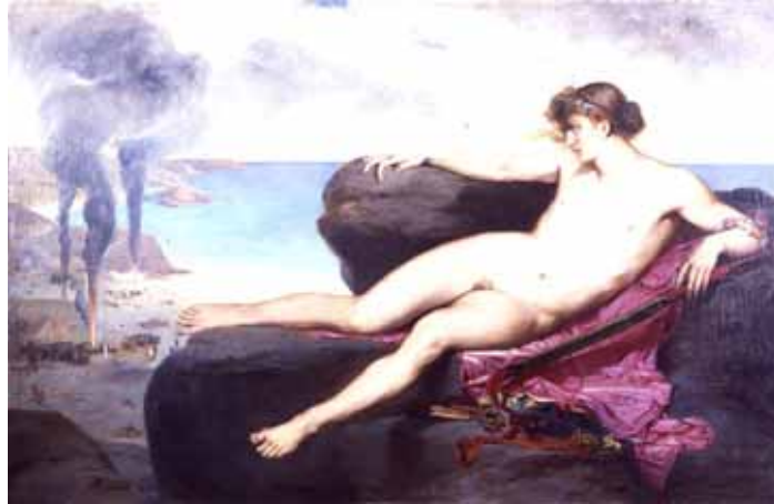
Apollon exterminateur , 1868 Castres, Musée Goya

A ce stade, on ne manquera pas de souligner que c'est une bien singulière décision qui conduit le jury à sélectionner à la fois l' Apollon exterminateur de Merson, soit un « exercice de fin d'année » et une œuvre aboutie, Le Balcon de Manet à la fin des années 1860, comme si les « autorités » voulaient ménager la tradition incarnée ici par un jeune peintre, mais aussi promouvoir la nouveauté, à condition qu'elle soit de bon aloi.