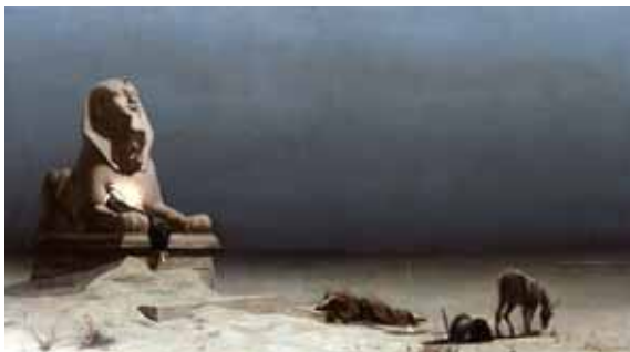
Le Repos pendant la fuite en Égypte , 1879 Boston, Museum of Fine Arts

Les premières ventes de l'artiste à des amateurs privés sont pour la plupart des tableaux religieux, l'exemple le plus significatif est Le Repos pendant la fuite en Égypte acquis pour une collection américaine. On y observe une originalité certaine puisque l'auteur a suivi un texte apocryphe c'est-à-dire rejeté par l'Eglise, mais la scène est, somme toute assez respectueuse du dogme pour intriguer sans choquer. Le goût pour la peinture religieuse correspond peut-être à l'exigence morale des élites américaines, mais il n'est pas absent des mentalités françaises, loin de là !