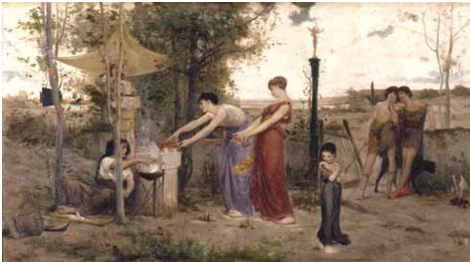
Le Sacrifice des poupées , 1871 Nantes, Musée des beaux-arts

Cette dérogation offre à Merson l'occasion de peindre des sujets antiques comme Le Sacrifice des poupées , et de continuer des travaux qui lui ont été commandés avant son départ (décoration pour l'église Saint-Nicolas à Nantes, projet inabouti).