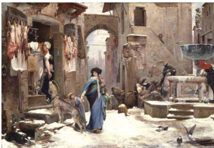
Le Loup d'Agubio , 1877

Parce qu'il ne s'est jamais éloigné de ce qu'on attendait d'un artiste qui garde en toile de fond les préceptes académiques, il s'est toujours montré en quelque sorte le bon élève de l'École des Beaux-Arts qui bride son talent (ou le garde sous le boisseau). Il met ses compétences au service d'un public qui cherche à reconnaître dans les œuvres d'art des références culturelles inculquées par un enseignement centré sur l'Antiquité ou l'Histoire des héros français. Dans ce sens, il n'est pas étonnant qu'il ait perçu comme nécessaire le recours à un réalisme « mesuré », sans le supplément d'âme qui fait souvent la différence.