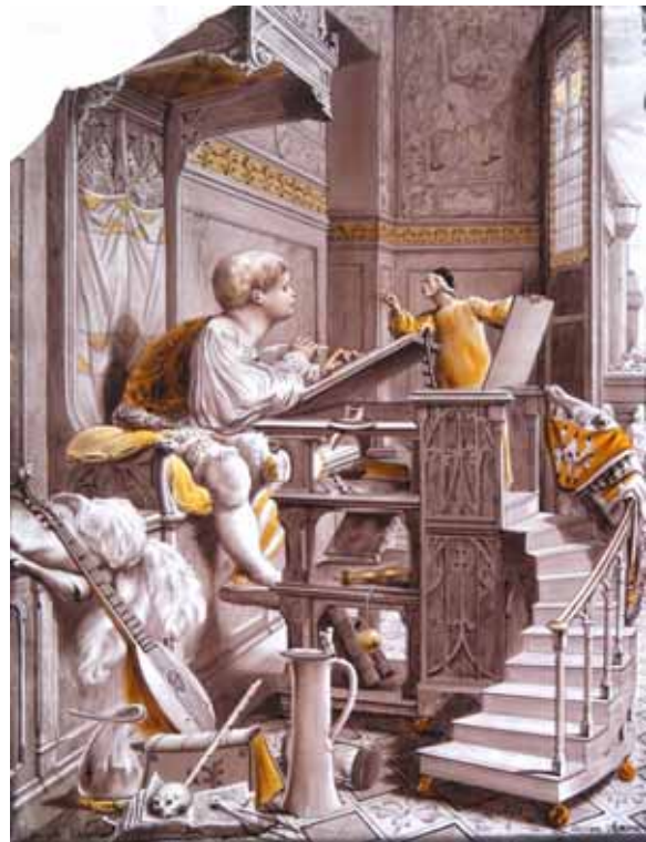
Scènes de la vie de Gargantua