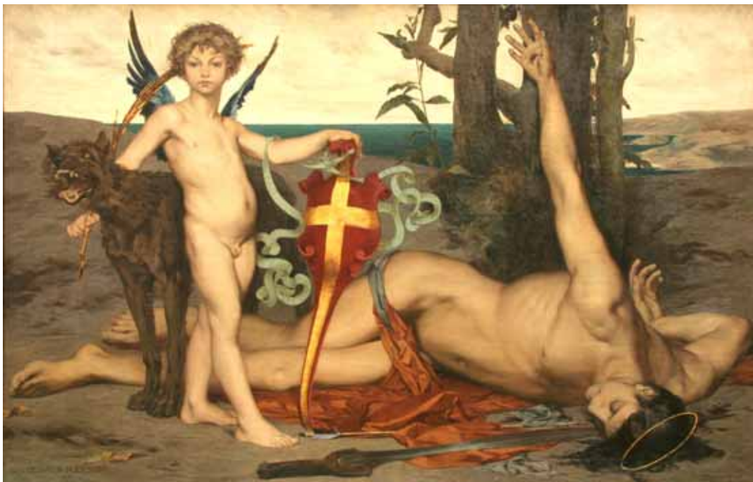
Saint Edmond, roi d'Angleterre, martyr, 1871 Troyes, Musée des beaux-arts

Après 1880, le Salon n'est plus du ressort de l'État, il devient l'affaire de la Société des artistes français, mais il garde son caractère officiel.