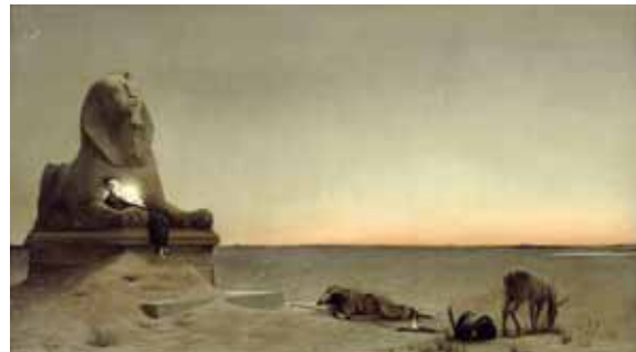
Le Repos pendant la fuite en Égypte , 1879 San Simeon, Hearst Castle