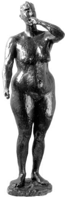
Germaine Richier, Pomone , 1945 Collection Musée des beaux-arts, Rennes