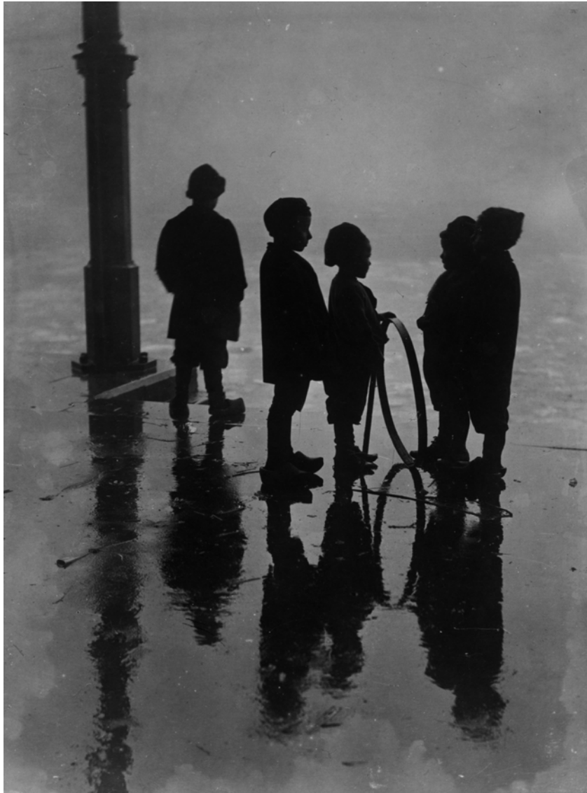
Berssenbrugge Henri, Garçon jouant avec un cerceau, Marché aux poissons, Rotterdam, vers 1910