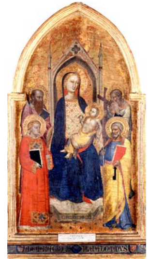
Tableau destiné à la dévotion privée qui met en évidence le rôle déterminant de la Vierge dans l'Église. Au cours du Moyen Âge, le culte marial se développe, notamment à partir du XII ème siècle ; les représentations de la mère du Christ, personnage majeur parmi les intercesseurs, reprennent des codes qui permettent sa réception par les fidèles.